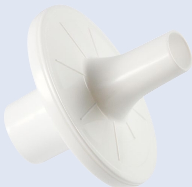
custo spiro protect Bakterien- und Virenfilter